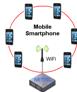
NETTEL usato come sistema di collegamento da campo con Smartphone Android